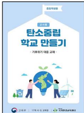
▲ 중등용 교육지도서