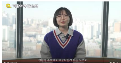
나의 비거니즘 만화, 보선 작가