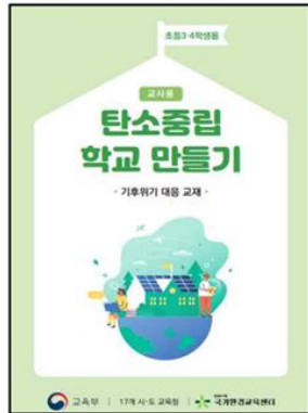
▲ 초등 3~4학년용 교육지도서