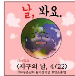
▲ 지구의 날 4/22