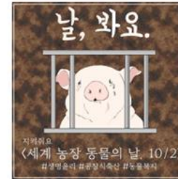
▲ 세계 농장 동물의 날 10/2