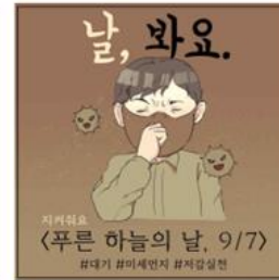
▲ 푸른 하늘의 날 9/7