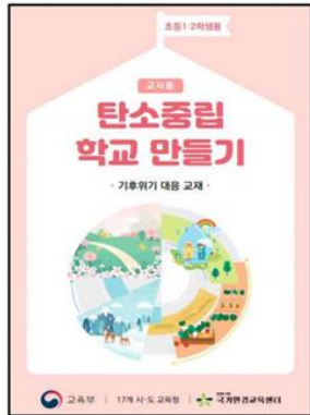
▲ 초등 1~2학년용 교육지도서