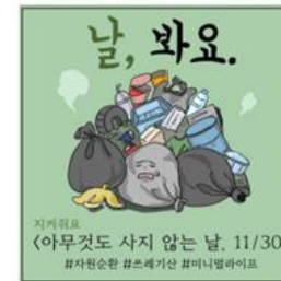
▲ 아무것도 사지 않는 날 11/30