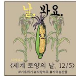
▲ 세계 토양의 날 12/5