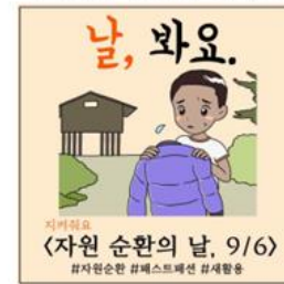
▲ 자원 순환의 날 9/6