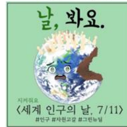
▲ 세계 인구의 날 7/11