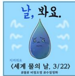
▲ 세계 물의 날 3/22