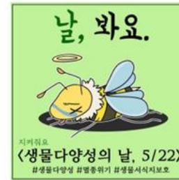
▲ 생물 다양성의 날 5/22