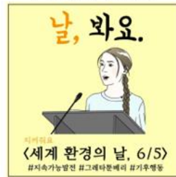
▲ 세계 환경의 날 6/5