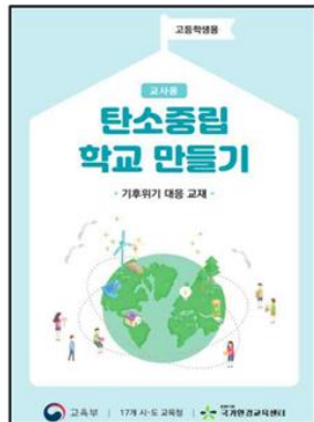
▲ 고등용 교육지도서