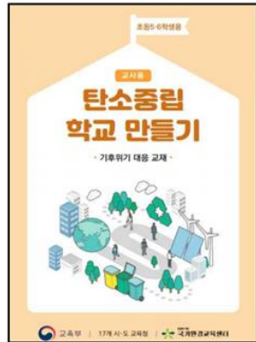
▲ 초등 5~6학년용 교육지도서