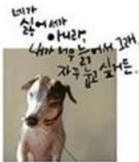
"아, 그러구나. 자꾸 끌고 다녀서 이런."