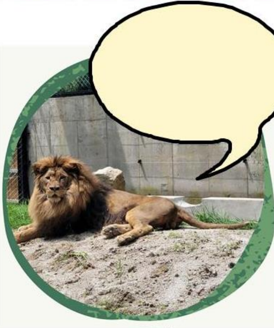
< 바람이 >

청주동물원에는 많은 친구동물들이 살고 있습니다. 마음에 드는 사탕을 골라 먹고, 친구동물들이 어떤 생각을 하고 있는지 속마음을 들어볼까요?