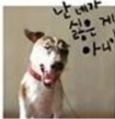
"그럼 왜 자꾸 도망가."