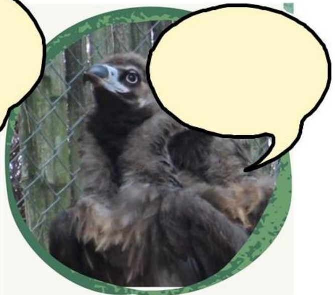
< 하나 >