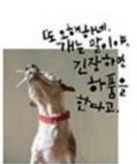
"그래? 그럼 왜 자꾸 나를 떠나는 거야?"