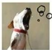
"알았다. 알았다. 내맘 보는 게 어렵다 이거지?"