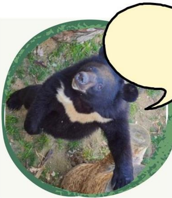
< 반이 >