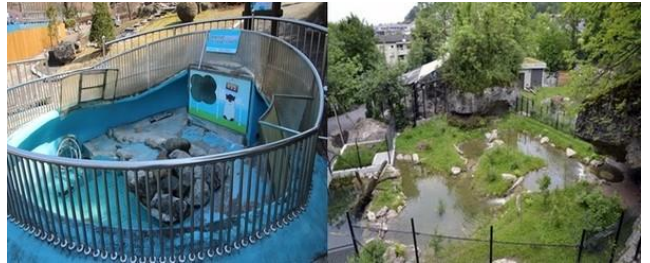
<청주 동물원의 수달사의 환경개선사업>