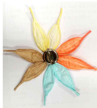
6. 꽃 뒷면에 브로치 핀 붙이기

※ 우리 학급이 활동한 내용을 모아 SNS에 올리고, '슬기로운 초록생활' 이벤트에 응모해 보세요~! 이 지도안은 충북자연과학교육원- PLAY 온라인 지원터- 환경교육- 공유마당에서 보실 수 있습니다. 다른 지도안도 많으니 수업에 맘껏 활용해 주세요~^^