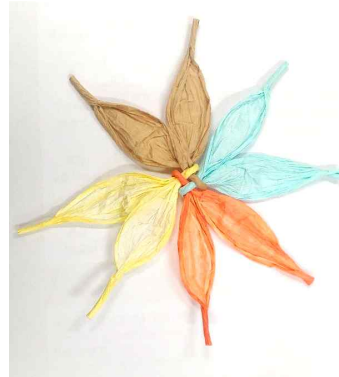
4. 꽃잎의 끝을 남겨두고 돌려가면서 꽃잎 펴주기