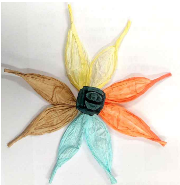
5. 꽃의 가운데 작은 열매나 지끈을 말아 붙이기