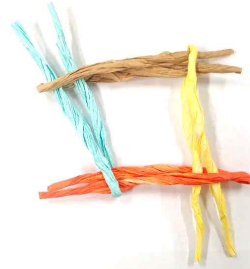
2. 지끈을 반으로 접고 고리를 만들어 井(우물정)자 모양으로 만들기